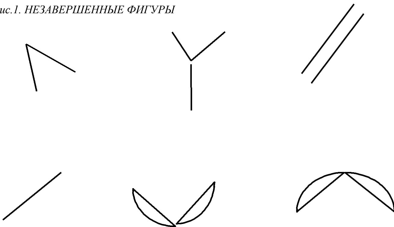
Рис.1. НЕЗАВЕРШЕННЫЕ ФИГУРЫ

Инструкция: Дорисуйте предложенные фигуры до целой картинке и придумайте и напишите к ним названия. Если хочется, можно рисовать несколько картинок по каждой фигуре. После работы с отдельными фигурами при желании можно создать общую картину, включающую в качестве отдельных ее частей все незавершенные фигуры и, конечно, что-то еще.